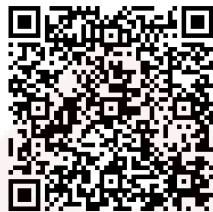
အစီအစဉ် အသေးစိတ်

ယခုအစီအစဉ်တွင် ရွေးချယ်ဖော်ပြခံရသည့် ဆောင်းပါးများသည် အာရက္ခလေ့လာရေးစင်တာ၏ အဘော်မဟုတ်ဘဲ စာရေးသူတစ်ဦးချင်းစီ၏ ကိုယ်ပိုင်ရေးသားတင်ပြချက်များ ဖြစ်ပါသည်။